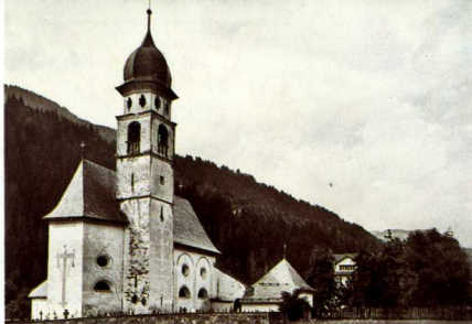
Vesta externa, entuorn 1935