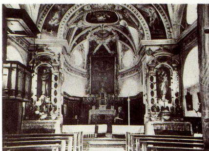
Vesta interna, entuorn 1935