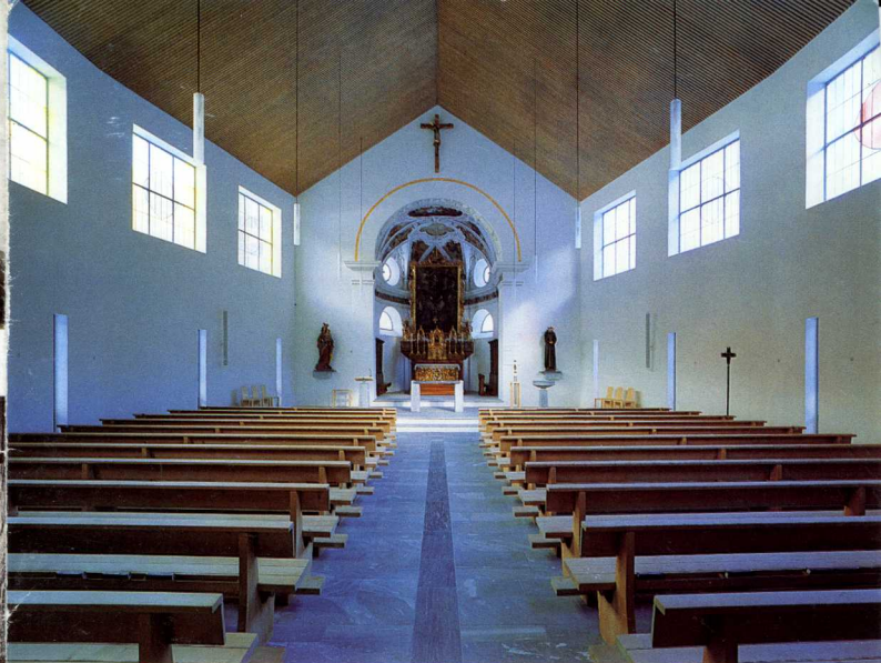
Baselgia catolica dalla s. trinitad Danis-Tavanasa